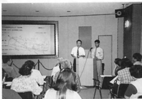
ネパール人のゲストを迎えて