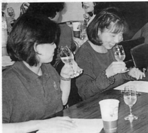
私、酔っちゃいそう...