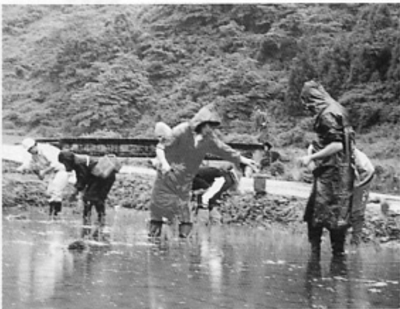
「植えた苗ふんたらいかんよ〜」

◎いろいろな人たちが、それぞれのホームページを作ることによって、これまでの自分の見直しができそうです。これからの自分を探るにも、役立ちそうです。楽しみにです! 四十代 女