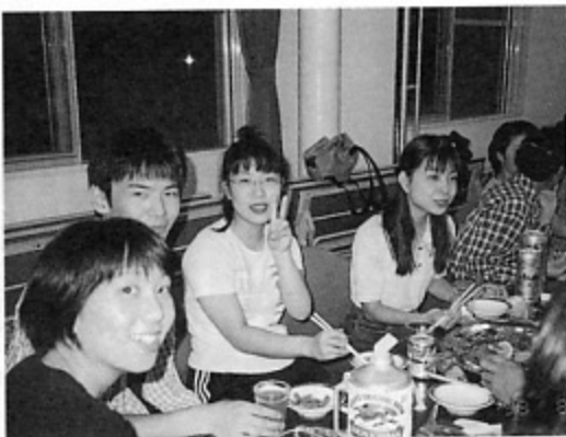
「飲みすぎて目の前に星があるう～」