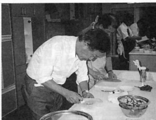
「包丁お！本ん〜」(「男性諸氏ノCookingしま専科?」)