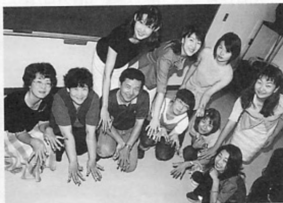
「みて、みて～ 私たちの作品!!」

ネイルアートというと、マニキュアを塗って爪にアートするものだと思っていました。しかし、実際は付け爪にいろんな色彩のアクリルパウダーを使って、立体的にアートしていくものでした。さて、いざ自分でテーマを決めて制作を始めようとするのですが、意外とテーマを決めるのが難しい作業でした。テーマが決まると、ワイヤーフレームで形を作ってそれに肉付けして形を整えて、会社で仕事をしているよりも真剣に(?)作業を進めました。制作すること四講義分。さて、その出来はどうだったかといいますが、十月二、四日の学遊祭で展示されることになっています。ぜひ見に来てほしいです。