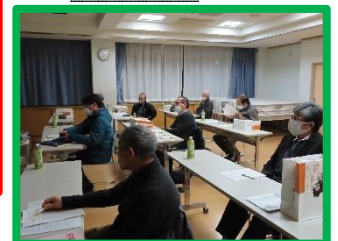
真剣に説明を聞く自治公民館