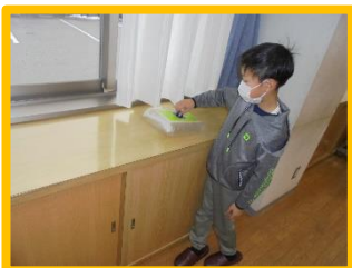
ホバークラフトがスイス

二つ目の実験は、“ホバークラフト”作りです。ポリ袋をそのまま動かそうとしても摩擦でなかなか動きません。しかし、その袋に空気が入る仕掛けをすることで、床の上を滑るように動きます。次にCDに風船を取り付けて、風船が縮む時に押し出す空気力で浮き上がらせるおもちゃを作っていました。