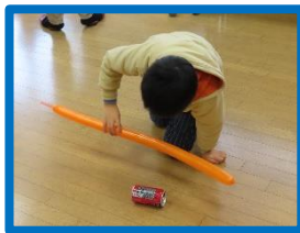
アルミ缶がコロコロ

一つ目の実験は、静電気です。細長い風船や下敷き、タフロンテープなどをティッシュでこすり、静電気力でアルミ缶を転がしたり、蛇口から出る水を曲げたりしました。また、魚に見立てたポリエチレンを下敷きに大量に付け、見えない静電気力を体感することが出来ました。