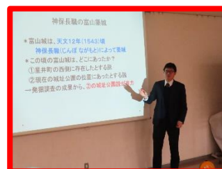
富山城の歴史を説明する講