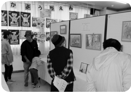
文化祭は240名の来場者でした

今年度は昨年度を上回る大勢の方に来場いただき有難うございました。今後とも皆様のご理解とご協力を宜しくお願い致します。