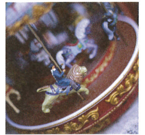
※画像はひとはこ市のイメージです