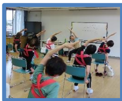
脇を伸ばすストレッチをしている参加者

お話の後は、専用のチューブを身体に巻いて肩や腕、腰をゆっくり動かしました。簡単で気持ち良いストレッチを続けること30分。チューブを外したみなさんの背筋が伸びていたことに驚きました。ぜひ、毎日続けていきたいですね。