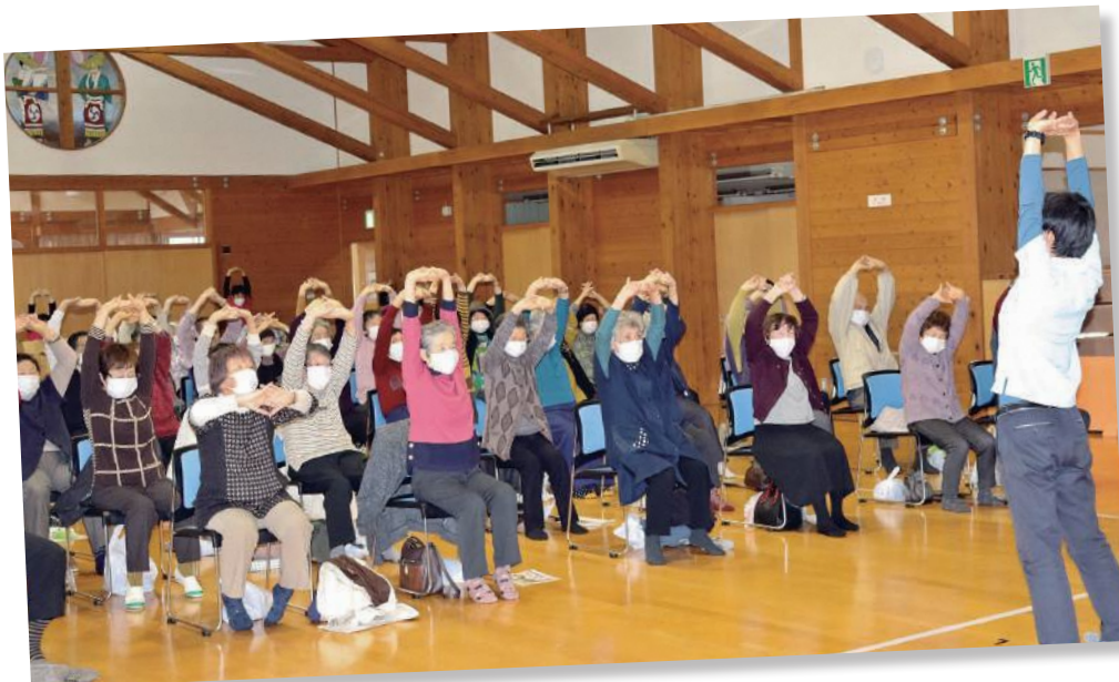
2021年11月25日開催 「敬老の集い」

コロナウイルス感染により健康や生命を脅かされる事態となりました。外出等の活動を自粛し、自宅に閉じこもる生活が長引くことによって生じるフレイル状態(加齢により心身が老い衰えた状態)にならないように介護予防が大切です。感染予防対策を徹底した上で、要介護状態にならないように、今年度は健康づくりに取り組みたいと思います。福祉協議会は、各地域でのいきいきサロン活動を積極的に支援、企画をサポートさせていただきます。加齢に伴う身体機能の低下を防ぐには「生活の中で少しでも動く時間を増やすこと」、「食事からタンパク質をしっかり摂ること」、「社会参加を積極的に行うこと」と言われています。皆様の積極的なサロン活動参加をお願いしたいと思っております。今年もどうぞよろしくようお願い申し上げます。