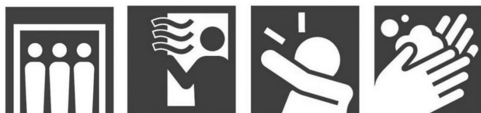
密閉回避 換気 咳エチケット 手洗い