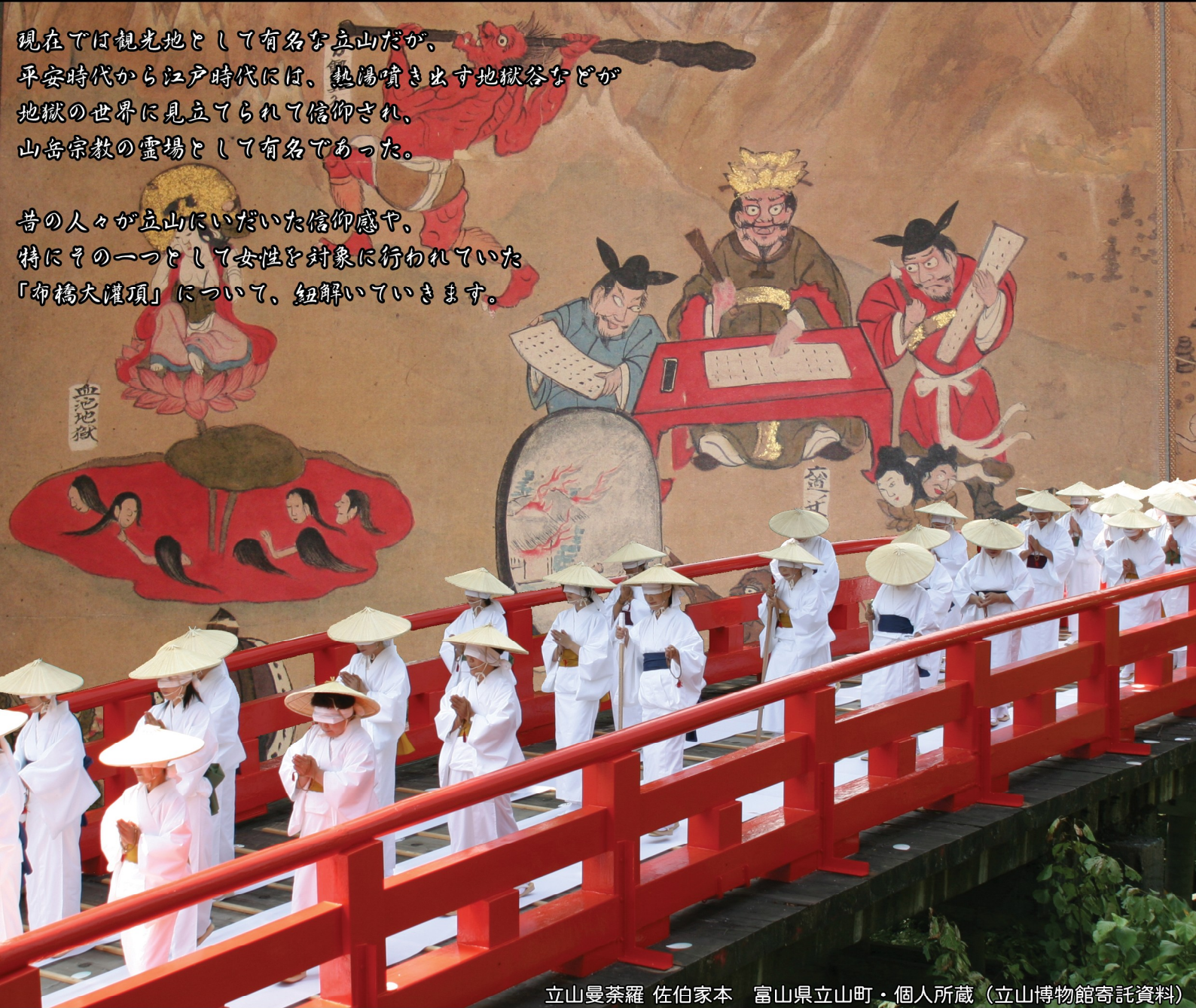
立山曼荼羅 佐伯家本 富山県立山町・個人所蔵（立山博物館寄託資料）

昔の人々が立山にいだいた信仰感や、 特にその一つとして女性を対象に行われていた 「布橋大灌頂」について、紐解いていきます。