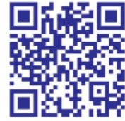
新川地区センターHP