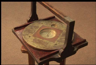
「軸心磁石版」と「強盗式磁石台」