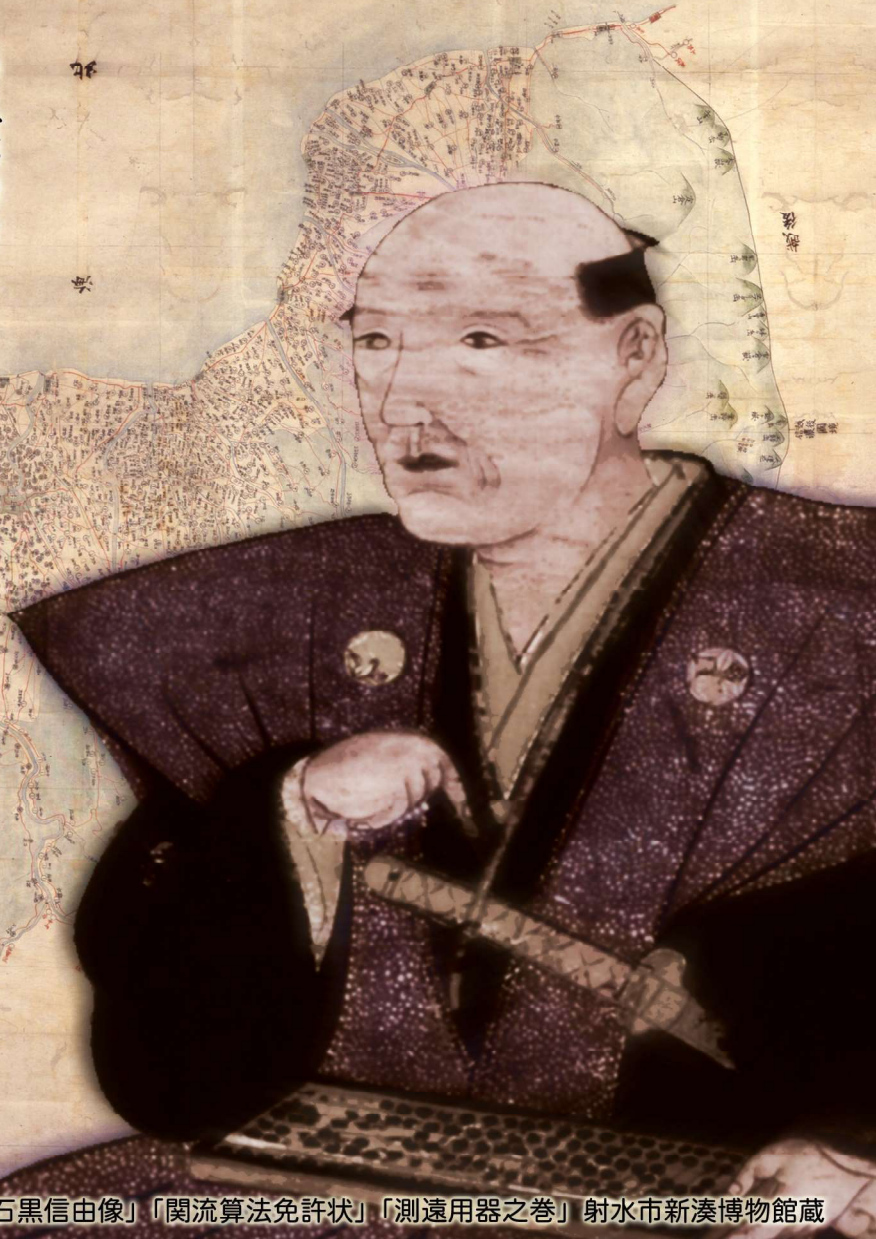
「越中四郡村々組分絵図」「石黒信由像」「関流算法免許状」「測遠用器之巻」射水市新湊博物館蔵