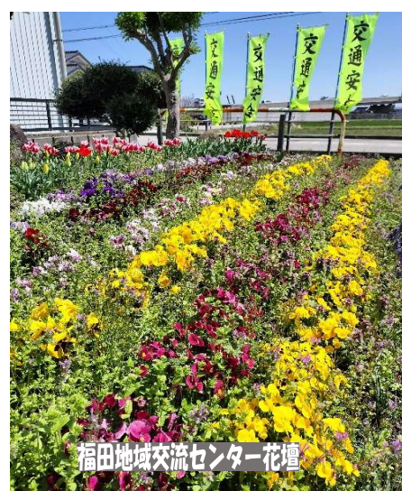
福田地域交流センター花壇