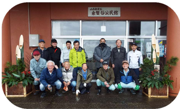
公民館で集合写真