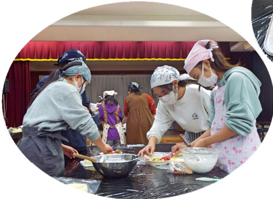
ふわふわのスポンジにクリームを 付けいちごや飾りをのせます