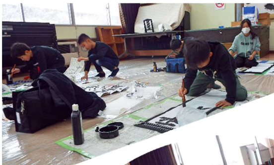
低・高学年の書初め練習