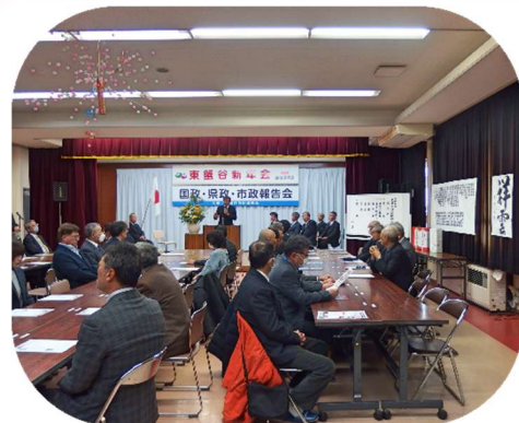
東蟹谷自治振興会「新年会」

令和八年の新春を迎え、皆様におかれましては、ますますご健勝にてご活躍のこととお喜び申し上げます。日頃より、公民館活動に格別のご理解とご協力を賜り、心より御礼申し上げます。さて、1月2日(金)には、東蟹谷自治振興会主催による新年会ならびに国政・県政・市政報告会が開催されました。新しい年の幕開けにふさわしく、改めて身の引き締まる思いで参加させていただきました。本書では、年末から年始にかけて公民館を中心に行われた各種活動の様子をご報告いたします。地域の皆様の温かいご協力のもと実施された取組の一端を、ひとときの時間にご覧いただけましたら幸いです。寒さ厳しき折、どうぞご自愛のうえ、本年も変わらぬご支援を賜りますようお願い申し上げます。