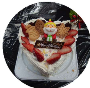
出来上がりました！