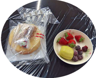
ケーキ作りの素材