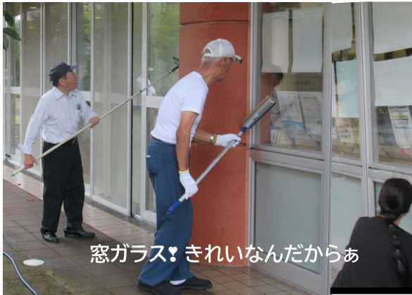
窓ガラス！きれいなんだからあ