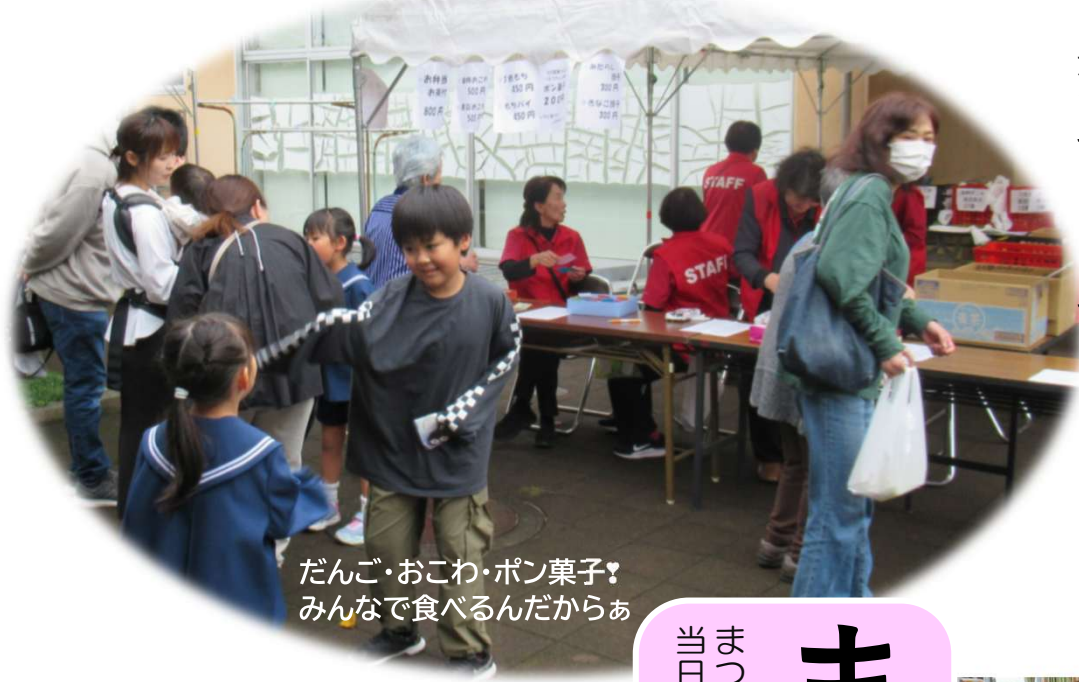
だんご・おこわ・ポン菓子！ みんなで食べるんだからあ

私たちの住む町には様々な可能性があり、その可能性は未来へと続く力をもっています。例えば公民館まつりで地域を盛り上げたという一人ひとりの小さな想いも、二人三人とだんだん大きく広がり、やがて、無限の可能性へとつながっていくのではないのでしょうか。