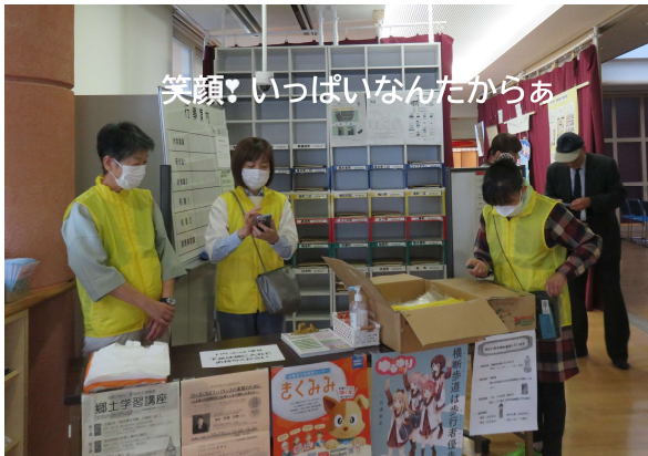
笑顔！いっぱいなんだからあ