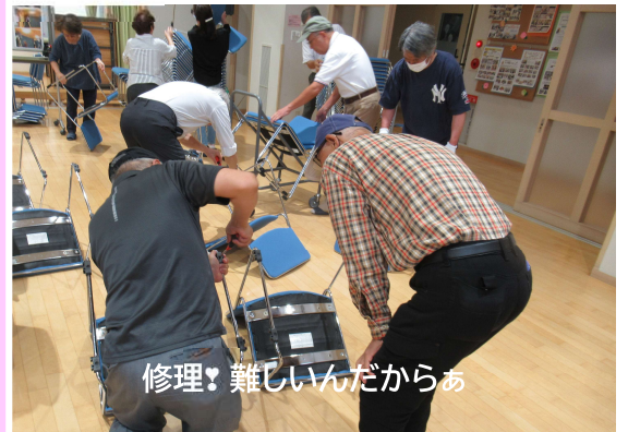
修理！難しいんだからあ