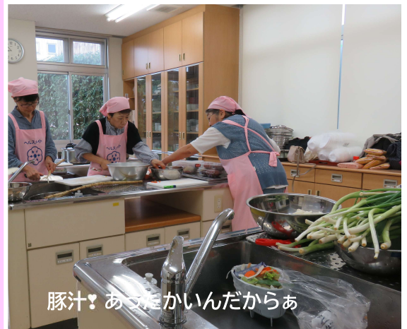
豚汁！あつたかいんだからあ