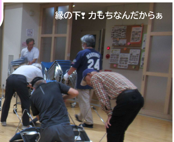
縁の下！力もちなんだからあ