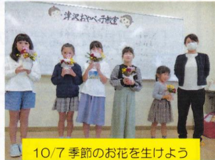
10/7 季節のお花を生けよう