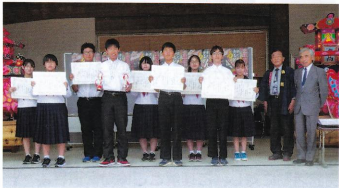
6/3 武者絵コンクール表彰式