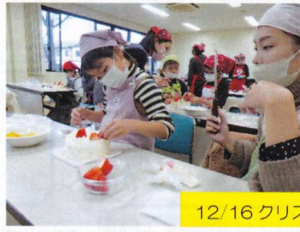
12/16 クリスマスケーキ作り