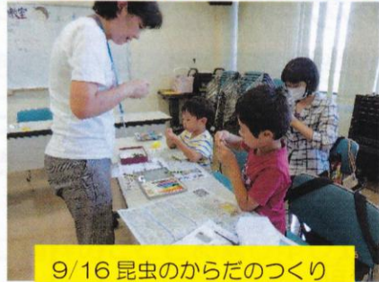
9/16 昆虫のからだのつくり