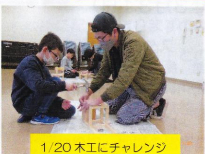
1/20 木工にチャレンジ