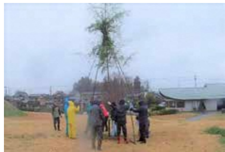
①前日のやぐら組み立ての様子