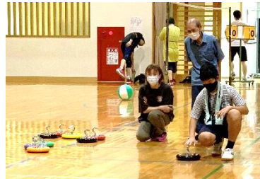
「カローリング体験」