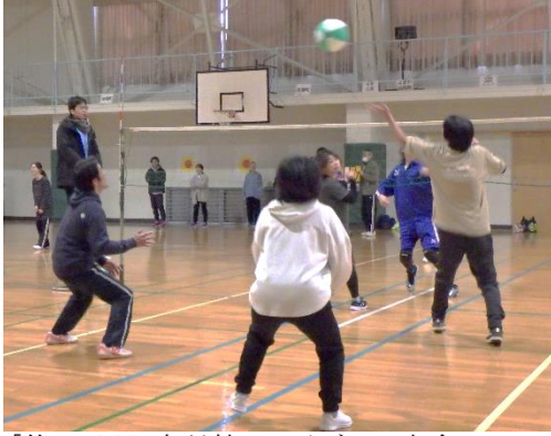
「第37回町内対抗ビーチボール大会」