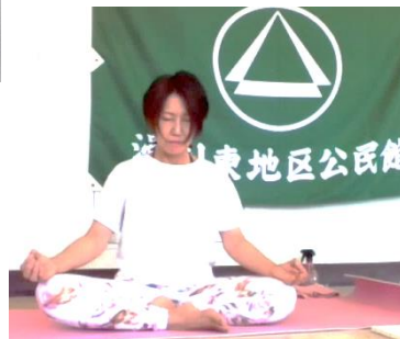
「骨盤調整ヨガ体験」