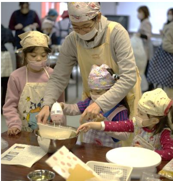
「クリスマスケーキづくり」