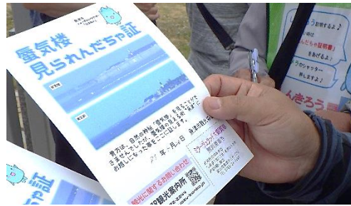
「健康ふれあいウォーク」