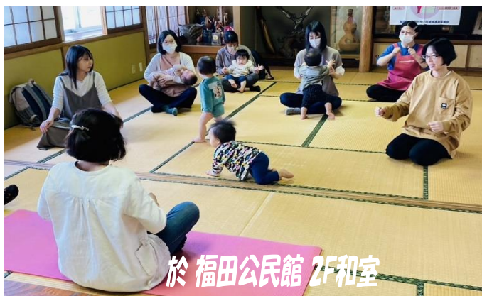
於 福田公民館 2F和室

福田地区では、他の町内でも9月17日から10月1日にかけて、市の空き缶ゼロ月間の活動に賛同し、ゴミ拾いを行いました。