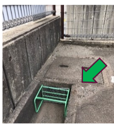
側溝の網カバーも作っていただきました

秋風とともに、ようやく過ごしやすい季節が巡ってきました。行楽・食欲・スポーツ・読書…そして、芸術と文化の秋を心ゆくまで堪能していただきたいと思います。長かった酷暑で疲れた心と身体をリフレッシュ!! 朝晩は急に冷えたりしますから、体調管理にご注意ください。