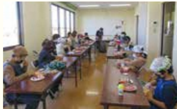
上手に組み立てられるかな

小学生対象で、クッキーをアイシングで組み立てて、お菓子の家を作りました。今年はクッキーが割れるなどハプニングもありましたが、割れたところもアイシングで付け直し、全員、かわいいクッキーの家を作ることができました。出来上がったお菓子の家は、おうちに持ち帰りました。