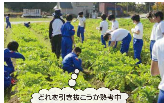
どれを引き抜こうか熟考中