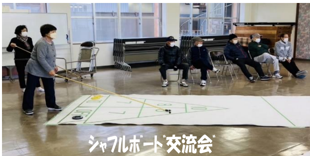
シャトルボード交流会

12/14(水)午後から福田福寿会のシャトルボード交流会と交通安全講習会が行われた。前半は、和気あいあいといった雰囲気です。シャトルボードを楽しんだ。後半は、高岡警察署交通課の方から、高齢ドライバーの免許更新についてや雪道での運転の注意点について講習を受け、皆さん真剣に話しを聴いていた。