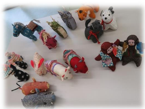
先生の作成した十二支たち

中表で縫い合わせ、耳、からだ、 しっぽ、目と合わせていきます。 完成すると、同じキットで作った のに目の位置、耳の角度で印象が 全く違う自分だけのうさぎが完成し ました!!お正月を迎える準備がで きました。