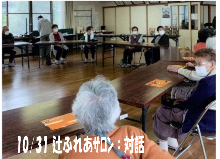
10/31 辻ふれあサロン：対話