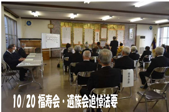
10/20 福寿会・遺族会追悼法要