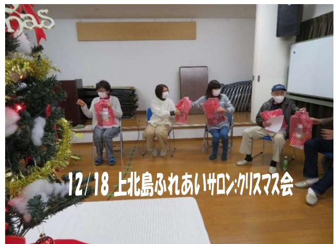
12/18 上北島ふれあいサロン:クリスマス会