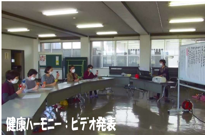
健康ハーモニー：ビデオ発表