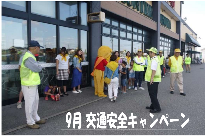
9月 交通安全キャンペーン