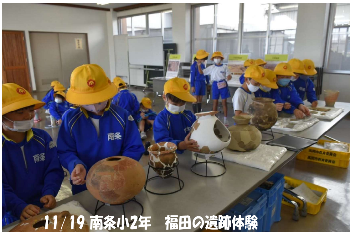
11/19 南条小2年 福田の遺跡体験