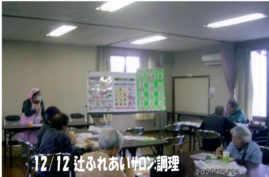
12/12 辻ふれあいサロン:調理