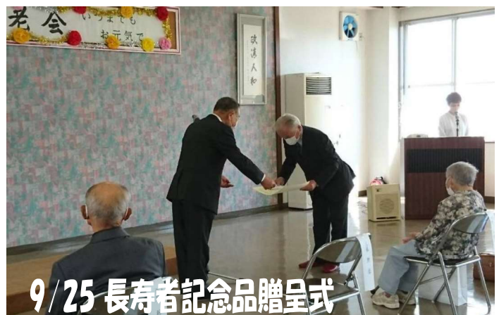
9/25 長寿者記念品贈呈式