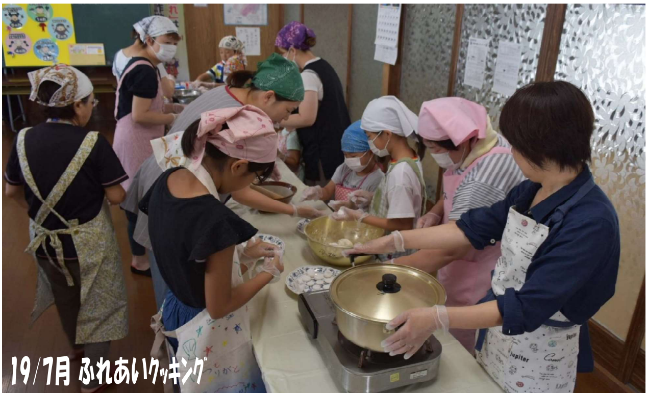
19/7月 ふれあいクッキング