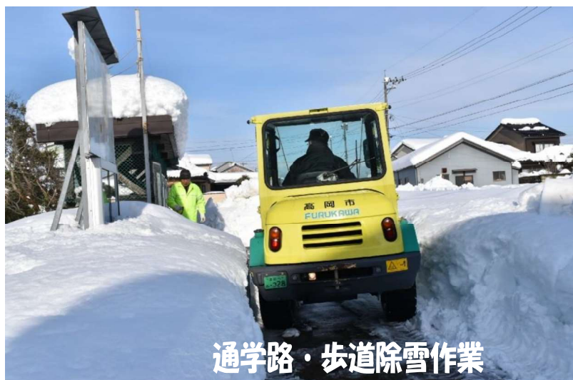
通学路・歩道除雪作業