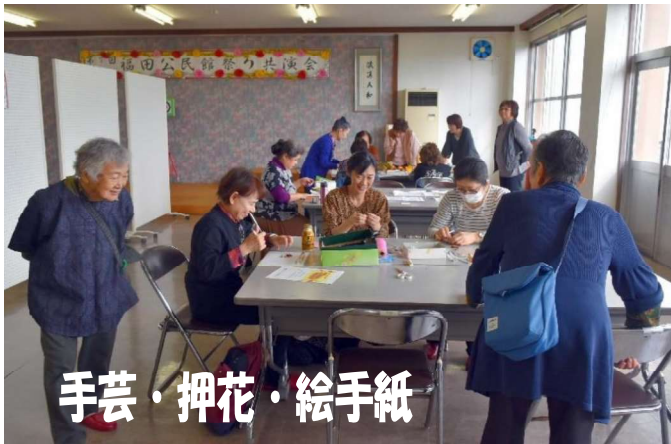
手芸・押花・絵手紙