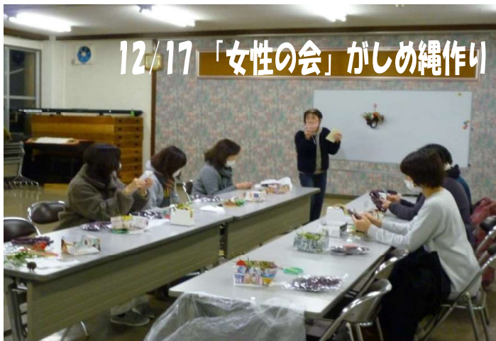
12/17 「女性の会」がしめ縄作り