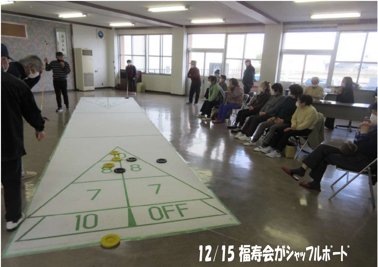
12/15 福寿会がシャッフルボード