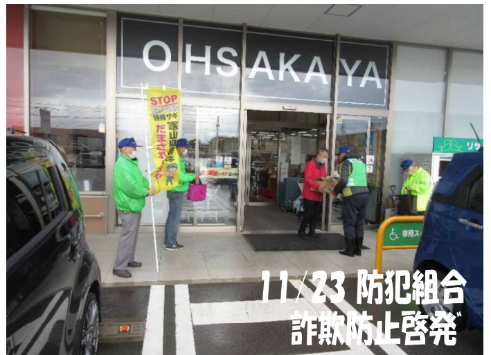
11/23 防犯組合 詐欺防止啓発