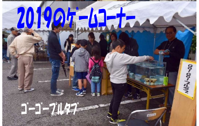
2019のゲームコーナー