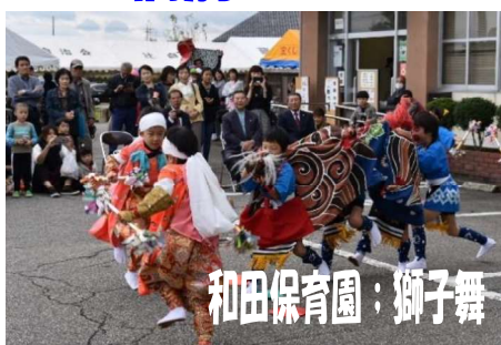
和田保育園：獅子舞