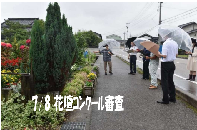
7/8 花壇コンクール審査