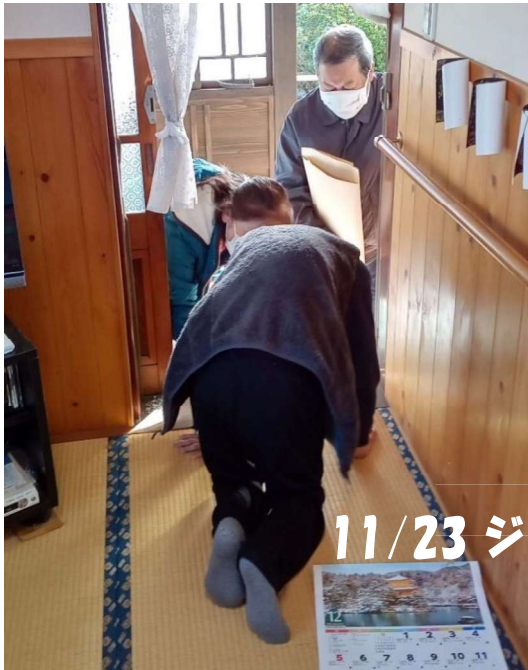
11/23 ジュニア福祉活動 友愛訪問