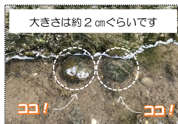
大きさは約2cmぐらいです

12月25日(火)黒瀬谷公民館の裏にある用水路に大きなタニシがいました。「自然が戻ってきとるん