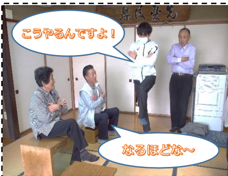
こうやるんですよ！