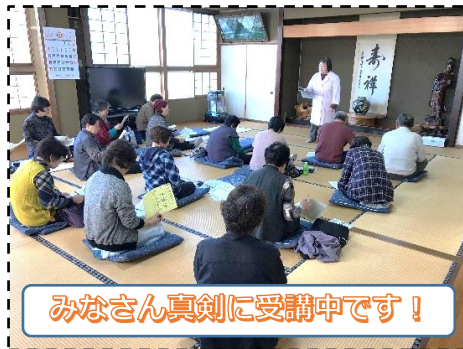
みなさん真剣に受講中です！

10月25日(木)「いきいきサロン」、11月9日(金)「健康まつり」、11月27日(火)「健康教室」が開催されました！ご友人とご一緒に参加されてる方が多く、和気あいあいとした講座となりました。また保健師さん監修で健康づくりには欠かせない「おいしく食べて脱口コモ！（介護予防食）レシピ」の講義と試食もあり、皆さん楽しくおいしそうに召し上がられていました！これからも講座で教わった体操と食事管理を続けて、お元気にお過ごしください！