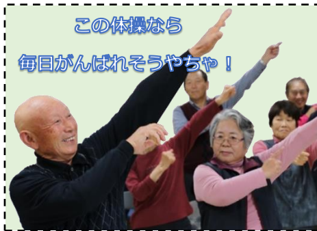
この体操なら 毎日がんばれそうやちゃ！

10月25日(木)「いきいきサロン」、11月9日(金)「健康まつり」、11月27日(火)「健康教室」が開催されました！ご友人とご一緒に参加されてる方が多く、和気あいあいとした講座となりました。また保健師さん監修で健康づくりには欠かせない「おいしく食べて脱口コモ！（介護予防食）レシピ」の講義と試食もあり、皆さん楽しくおいしそうに召し上がられていました！これからも講座で教わった体操と食事管理を続けて、お元気にお過ごしください！