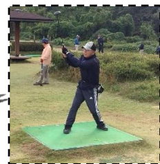
夏のリベンジ果たしたよ！

11月4日(日)神通川水辺プラザにて「第17回パークゴルフ大会」が開催されました。当日は18名の方に参加して頂きました。お天気も良くコースのコンディションも整っており、参加された皆さんもプレーに集中することができました！