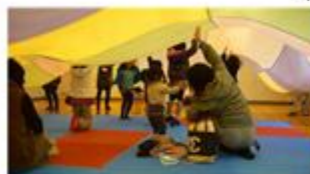
鳴子と鈴でクラシック音楽会

2月2日(日)「第8回ひばりっ子集まれ!」を戸破コミュニティセンターで開催しました。今年度最終回の異世代交流「音楽でふれあう地域の輪」と題し、様々なメロディーが流れる中、趣向を凝らした体験ができ、笑い声があふれ、心も体も温まりました。